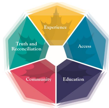
Figure 1: Expérience – Vérité et réconciliation – Communauté – Éducation – Accessibilité

Notre plan stratégique quinquennal, Évaluer notre impact civique, a connu son aboutissement avec la publication du Cadre de l'impact civique de l'opéra. Élaboré avec la firme Good Roots Consulting, il reflète les pratiques civiques actuelles dans le secteur de l'opéra, et sa conception vise à capter de manière itérative les données sur l'impact, le tout en vue d'appuyer l'engagement du secteur de l'opéra de créer un impact civique solide et positif dans les collectivités canadiennes. On y trouve cinq grands domaines thématiques pour l'impact civique où peuvent s'inscrire les diverses activités connexes : éducation, accessibilité, communauté, expérience et vérité et réconciliation.